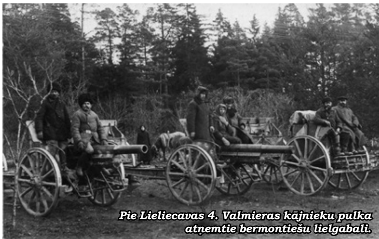
Pie Lieliecavas 4. Valmieras kājnieku pulka atņemtie bermontiešu lielgabali.

vajadzēja noiet apm. 30 km, un tas varēja plkst. 16 sasniegt Lieliecavu. Veikhmaniešu stāvoklis bija tiešām grūts. Pēkšņi aizmugurē no muižas atskanēja strēlnieku kaujas troksnis. Otrs latviešu bataljons, nākdams no ziemeļaustrumiem, bija atspiedis muižas izeju vājo apsardzību un, ejot pa daļai pa aizsalušo Iecavas upi, bija ielauzies muižā. Iesākās šausmīga slepkavība un laupīšana. Kara materiāli un baterijas priekšrati palika ienaidnieka rokās. Garnizons ar grūtībām izglābās no gūsta. Bataljona komandieris atzina par neiespējamu turpināt aizstāvēšanos un pavēlēja atkāpties uz Codes muižu. Atsevišķās grupās ļaudis izlauzās cauri. Ja kāds palika iepakā, viņu ķēra ienaidnieka lode. Dziļi satrikti un zaudējuši visas mantas, karavīri atsevišķās grupiņās lasījās uz ceļa un vakarā iegāja Codē, kur sastapa Damma ložmetēju nodaļu, kura no Bauskas nāca pretim...»