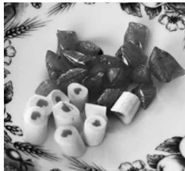
Medus karameles ar propolisu un ziedputekšņiem.