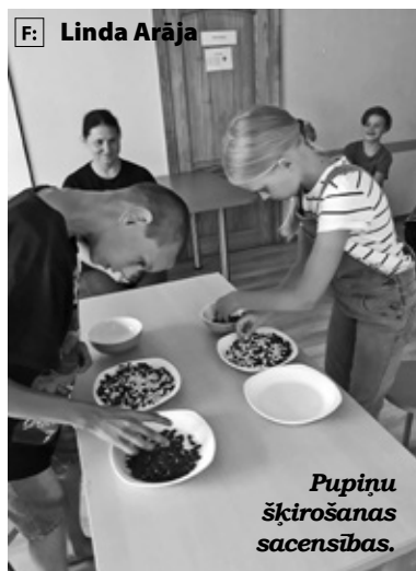
Pupiņu šķirošanas sacensības.

(ESF) projektam «Vietējās sabiedrības veselības veicināšana un slimību profilakse Iecavas novadā». Trīs gadu laikā šo iespēju ir izmantojuši 45 bērni.