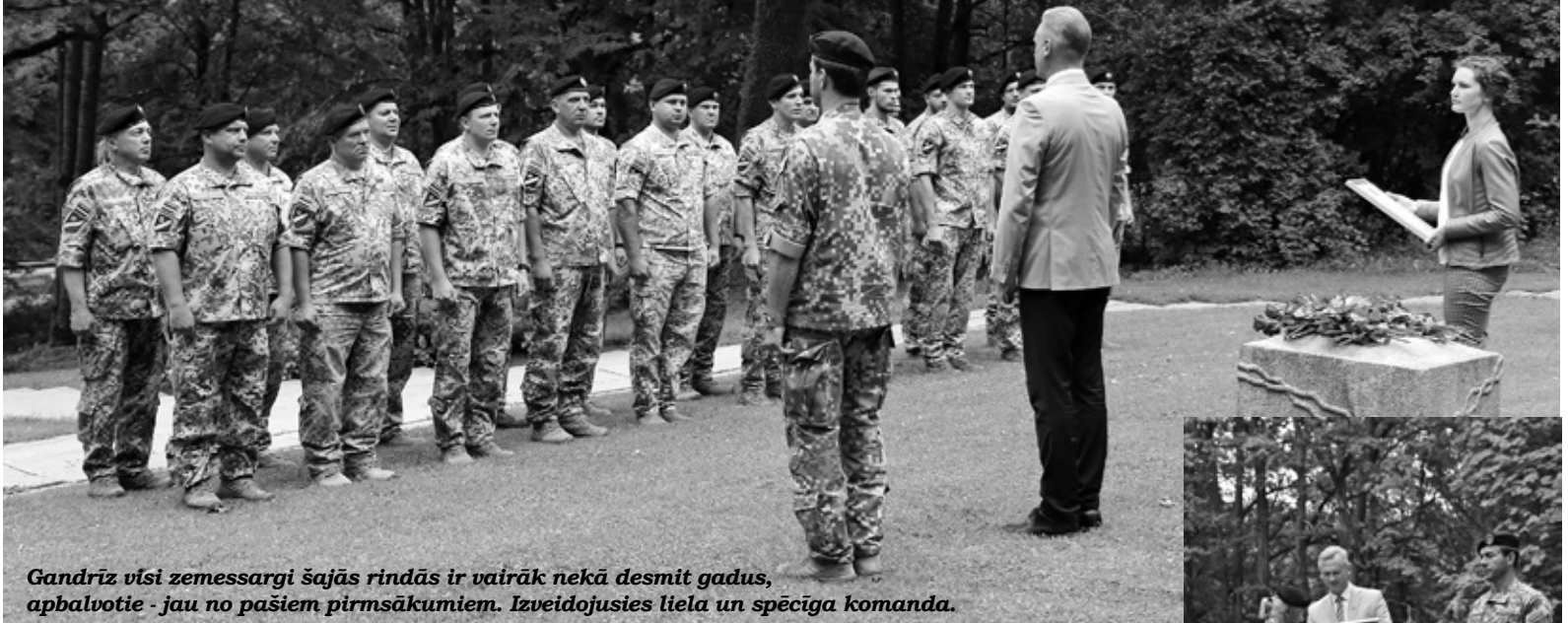
Gandrīz visi zemessargi šajās rindās ir vairāk nekā desmit gadus, apbalvotie - jau no pašiem pirmsākumiem. Izveidojusies liela un spēcīga komanda.