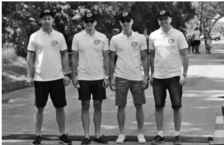
Organizatori darbojās saskaņoti un bija atpazīstami pēc vienošanās formas ar biedrības «Velo Iecava» simboliku.