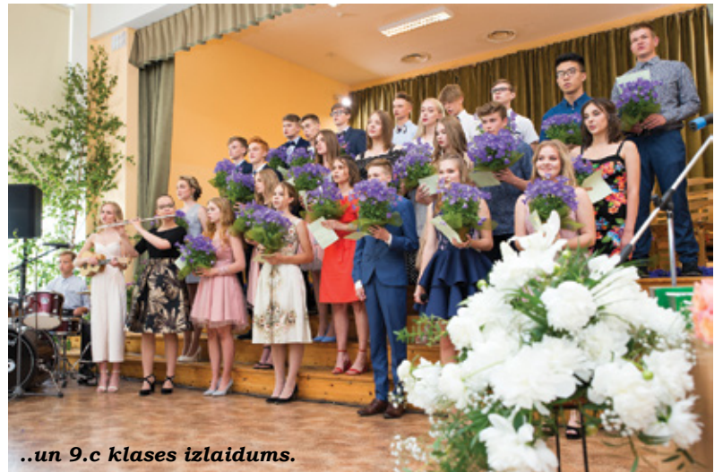
..un 9.c klases izlaidums.