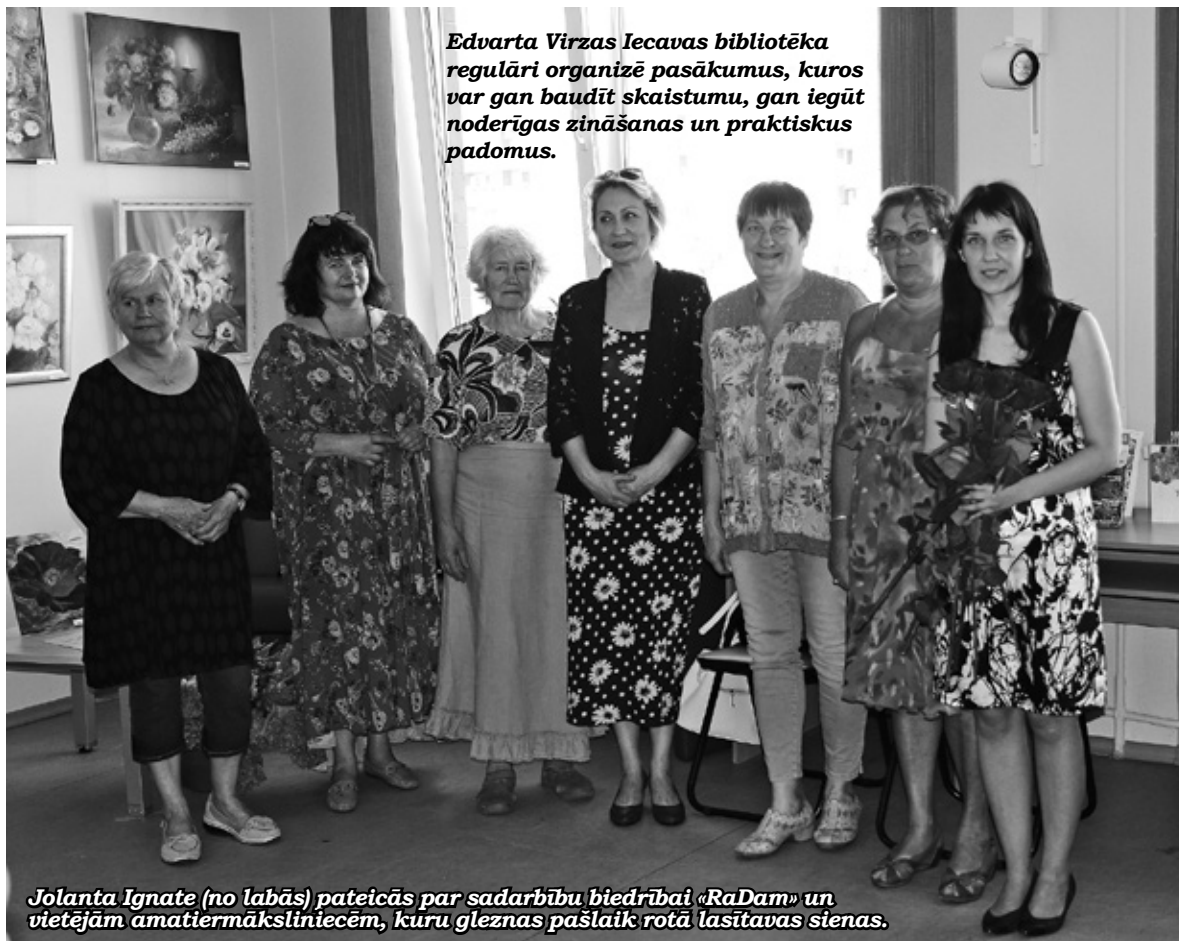
Edvarta Virzas Iecavas bibliotēka regulāri organizē pasākumus, kuros var gan baudīt skaistumu, gan iegūt noderīgas zināšanas un praktiskus padomus.

Stādot puķenes, jāpārrok zeme vismaz trīs lāpstu dziļumā. Ja augsne pārāk smaga, jāpievieno komposts vai trūdzeme. Svarīgākais – neiestādīt ne-