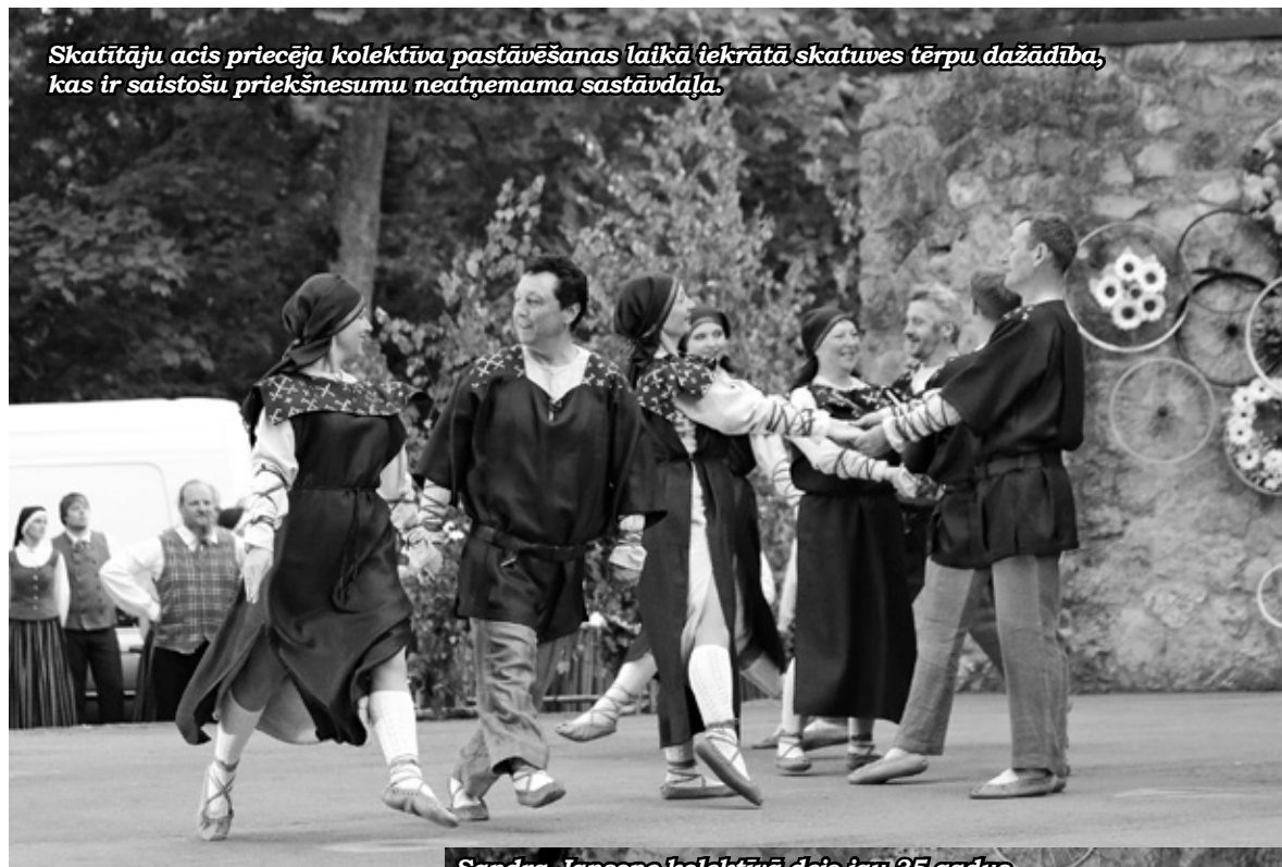
Skatītāju acis priecēja kolektīva pastāvēšanas laikā iekrātā skatuves tēru dažādība, kas ir saistošu priekšnesumu neatņemama sastāvdaļa.

Mājinieki programmā bija iekļāvuši tādas skatītāju iemīļotas deļas kā «Svīres tango», «Jā, šos vārdus», «Tōli dzeļvoj», «Ābrama polka». Kon-