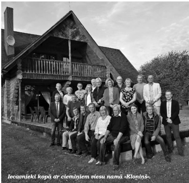
Iecavnieki kopā ar ciemiņiem viesu namā «Kloniņš».

Vakarā neformālā gaisotnē viesi no Billerbekas un Terebodas tikās ar Iecavas novada domes deputātiem un vairākiem pašvaldības administrācijas