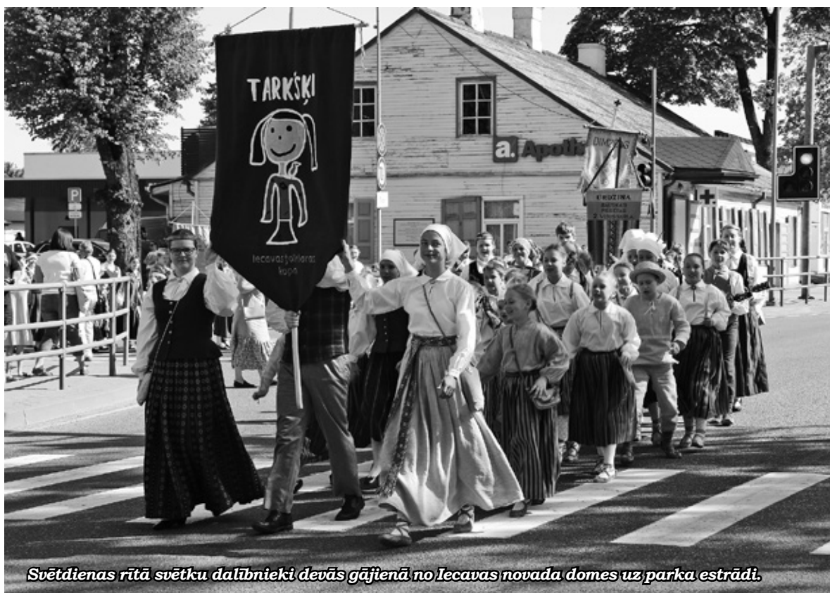
Svētdienas rītā svētku dalībnieki devās gājienā no Iecavas novada domes uz parka estrādi.