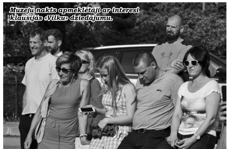
Muzeju nakts apmeklētāji ar interesi klausījās «Vilku» dziedājumu.