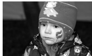
Biedrības jau uzsākušas savu projektu īstenošanu. 4. maijā Iecavas Jauniešu padome organizēja Baltā galdauta svētkus.

Sabiedrisko organizāciju, biedrību, nodibinājumu un tradicionālo reliģisko organizāciju projektu līdzfinansēšanas konkursā šogad bija saņemti 15 pieteikumi, bet pēc izvērtēšanas noslēgti līgumi par 12 projektu īstenošanu (tabulā blakus), kopsummā tiem visiem atvēlot 15 000 eiro pašvaldības līdzfinansējumu. [Z]