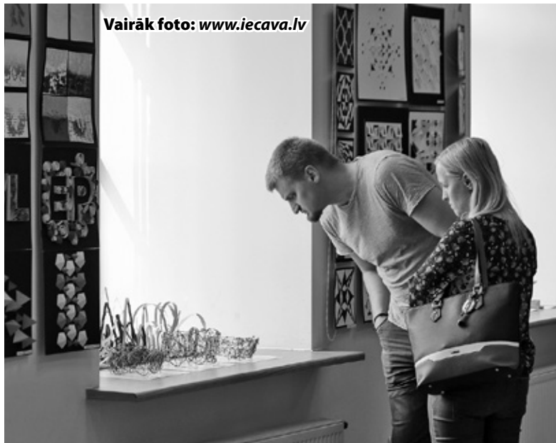
Vairāk foto: www.iecava.lv