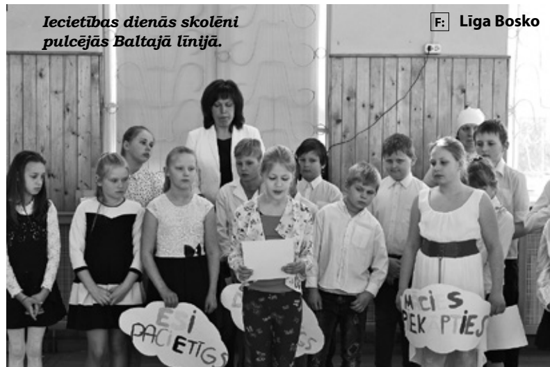
Iecietības dienās skolēni pulcējās Baltajā līnijā.