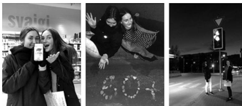
Komandas «Nāras» aktivitātes spēles laikā.

Paldies visiem par piedalīšanos. Uz tikšanos citos pasākumos! IZ