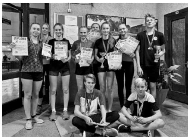
U-16 grupas viegl- atlētikas sacensību laureāti.