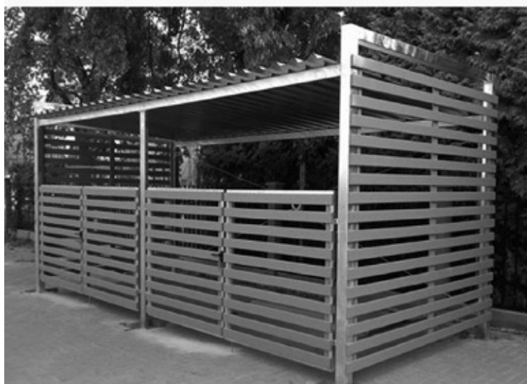
Atkritumu konteineru novietnes varianti.