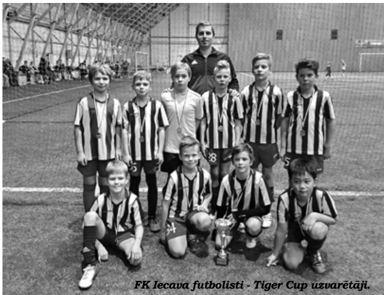
FK Iecava futbolisti - Tiger Cup uzvarētāji.