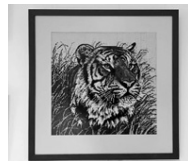
No A. Meldera darbu izstādes.