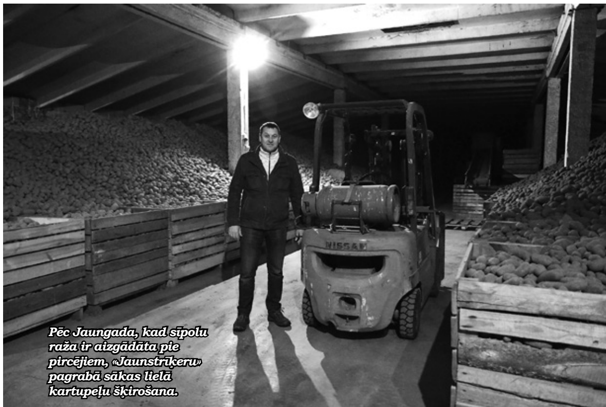
Pēc Jaungada, kad sīpolu raža ir aizgādāta pie pircējiem, «Jaunstrīķeru» pagrabā sākas lielā kartupeļu šķirošana.