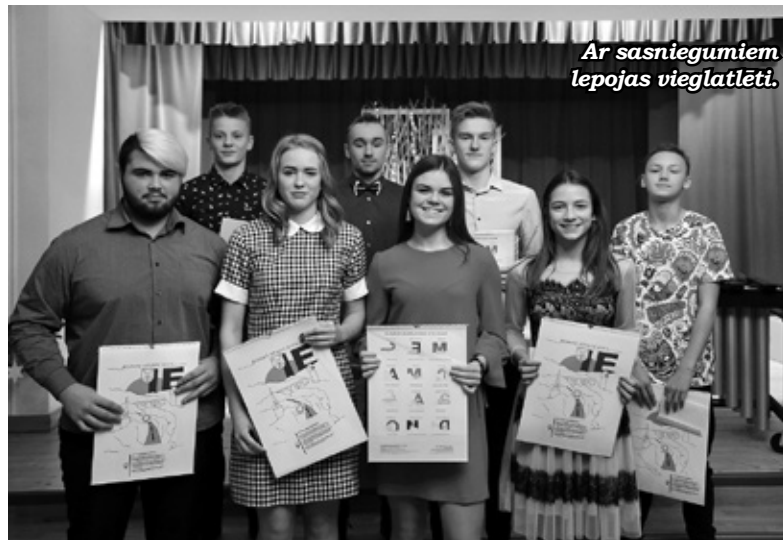
Ar sasniegumiem lepojas vieglatlētī.