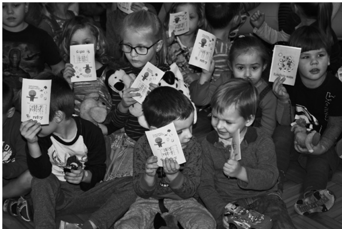
«Dartijas» audzēkņi, mainoties ar rotaļlietām, saņēma arī ar simbolu «Retoy» zīmogotu rotaļlietas pasi.

Globālās izglītības nedēļa (GIN) šogad notika jau 15 Eiropas valstīs. Tās iniciators ir Eiropas Padomes Ziemeļu Dienvidu centrs. Latvijā GIN notiek jau piekto gadu, to īsteno Latvijas Platforma attīstības sadarbībai (LAPAS) kopā ar biedru organizācijām un partneriem, augstskolām, izglītības iestādēm un citiem atbalstītājiem reģionos. GIN ietvaros notiek vairāki desmiti pasākumu visā Latvijā, iesaistot simtiem interesentu diskusijās par Latviju un pasauli. IZ