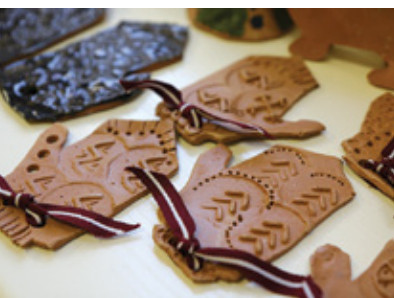
Pirmsskolas izglītības iestādē «Cālītis»