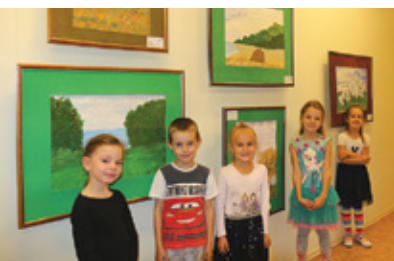
Pirmsskolas izglītības iestādē «Dartija»