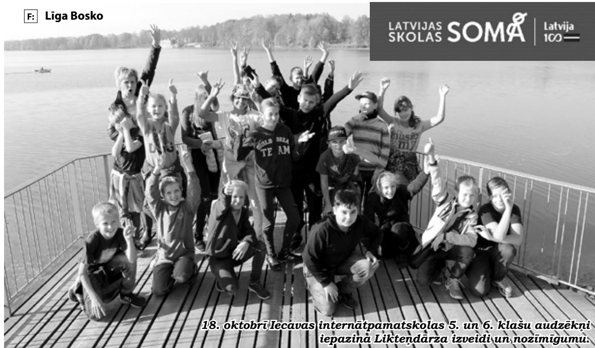
18. oktobrī Iecavas internātpamatskolas 5. un 6. klašu audzēkņi iepazīnā Likteņdārza izveidi un nozīmīgumu.

Tā kā programma «Latvijas skolas soma» ir viena no mācību satura sastāvdaļām, tad izglītības iestādes pašas izvēlas aktivitātes no piedāvātā klāsta, tās pielāgojot saviem mācību un audzināšanas darba plāniem. Tēmu un pasākumu atlasē piedalās gan skolēni, gan priekšmetu skolotāji, klases audzinātāji un metodisko apvienību vadītāji.