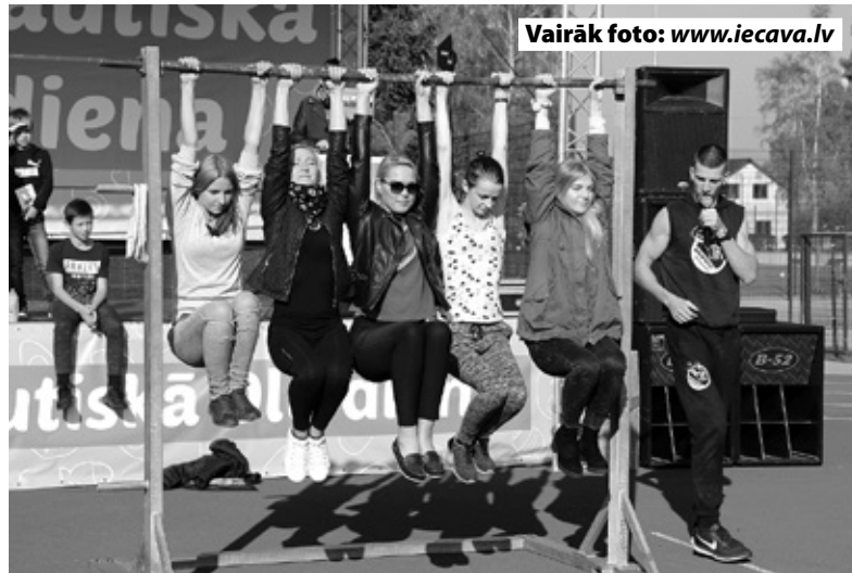
Vairāk foto: www.iecava.lv

«Uz pasākumu atrācām kopā ar meitiņu, jo šeit varam piedalīties dažādās aktivitātēs, krāsot, priecāties par balonu. Nav jau tā, ka Iecavā nebūtu pasākumu. Tie tiek organizēti gan Lieldienās, gan citos svētkos, un mēs vienmēr cenšamies tos ap-