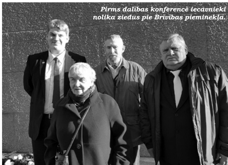
Pirms dalības konferencē Iecavnieki nolika ziedus pie Brīvības pieminekļa.

Otrās sesijas laikā LTF priekšsēdētājs (1990-1992) Romualds Ra-