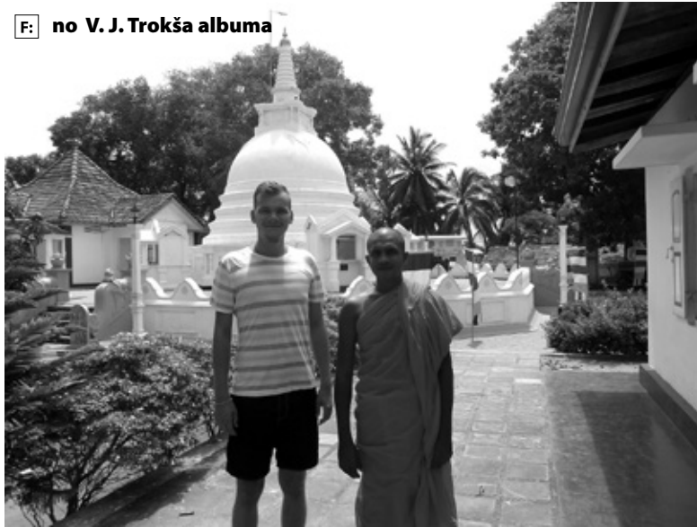
Verners kopā ar Ambalangodas vietējo mūku.