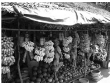
Augļu stends pie lielceļa.

Šrilankieši pret ģimeni izturas ar lielu cieņu, bieži vien vairākas paaudzes dzīvo kopā, lai varētu rūpēties cits par citu. Taču, manuprāt, mīnuss ir tas, ka vecāki pārsvarā nosaka, ko darīs bērni. Vecvecāku mājas pagalmā atrodas arī bērnu dārzs, ko