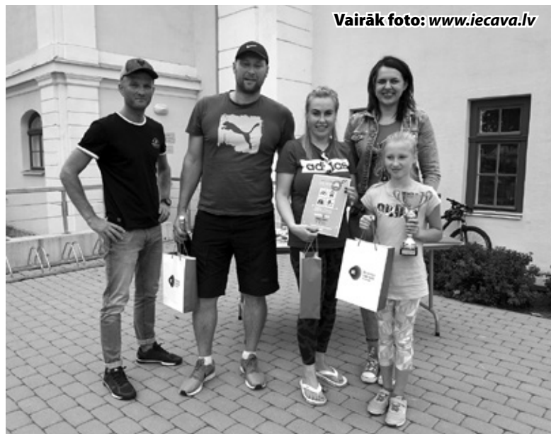
Vairāk foto: www.iecava.lv