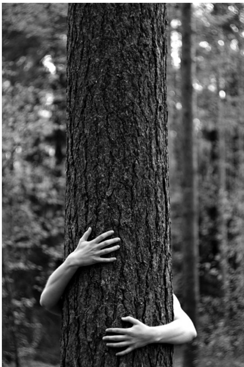
Annas mīlākā pašas radītā fotogrāfija ir arī šīs izstādes galvenais eksponāts.