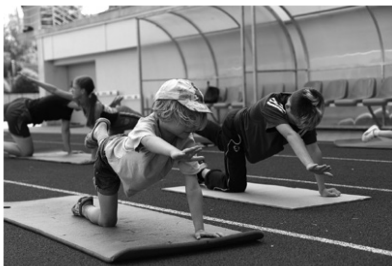
Nometnes dalībnieki labprāt iesaistījās sportiskajās aktivitātēs, lai pārbaudītu, kuram izdosies vislabāk, visātrāk vai kuram vairāk izturības.