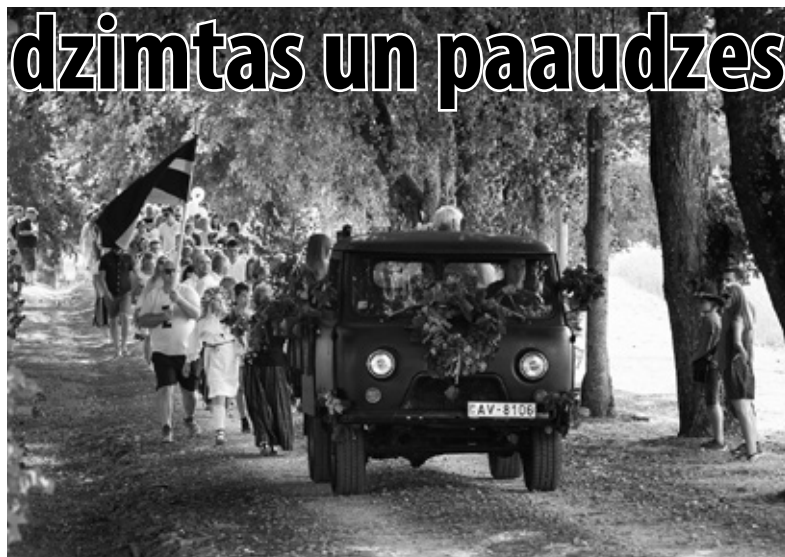
Svētku gājiens ar mūziku un dziesmām virzījās cauri visam ciemam. Iedzīvotāju atsaucība bija apbrīnojama - gājienā piedalījās gandrīz 200 iedzīvotāji.

Interesanti, ka tieši svētku dienā saņēmām kārtīgu dāvanu - labiekārtotu Zorģu pieturvietu posmā Iecava-Bauska, kuru lietos katrs Zorģu iedzīvotājs. Realizējās pirmā mūsu kopīgā iedzīvotāju iniciatīva - vēlmes izteikšana Latvijas Valsts ceļiem par pieturvietas labiekārtošanu. Kopā mēs varam! Z