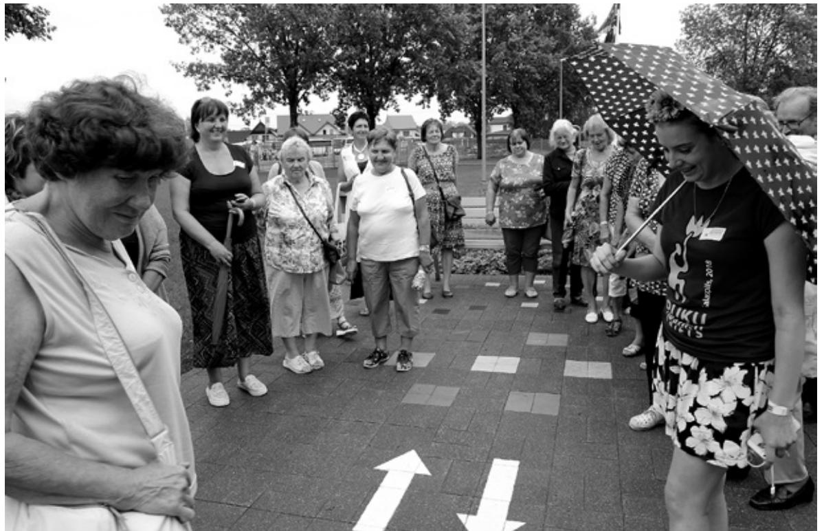
Salaspils 1. vidusskolas ārtelpā, kas pielāgota visdažādākajām aktivitātēm.

Brunovsku ģimenes īpašumā « Puķes » apmeklētājus sagaida saņemta un ziedoša apkārtnē. Ne tikai puķu stādījumi, bet arī saimnieciskā zona priecē ar sakārtotību. Pārliecināties, ka arī komposta kaudze var būt dārza rota, nevis no acīm slēpjama vieta. Gribētos teikt, ka «Puķēs» valda dienvidnieciskais saulainums, jo pāri visam ar savu košumu izceļas žilbinoši dzelteno liliju dobes, bet, ieejot siltumnīcā, virs galvas karā-