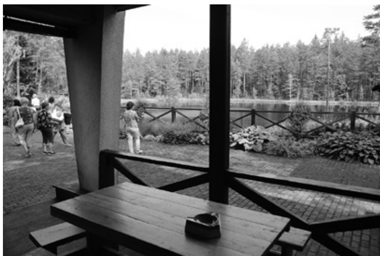
«Kārļi» - īsta miera osta, kuru paši saimnieki sauc par paradīzi nekuriene. Īpašumā izveidots arī viesu nams «Pie Kārļā».