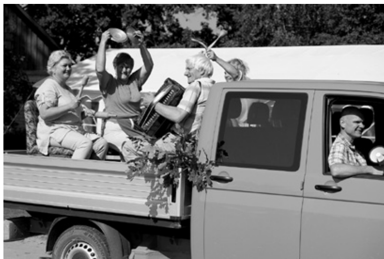
Svētku rīta lustīgā modināšanas komanda.