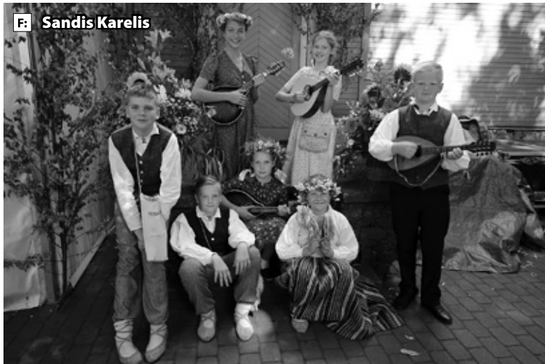
Daļa «Tarkšķu», kas jestrī muzicēja Folkloras dienā.