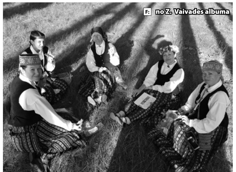
F no Z. Vaivades albuma

Jauktā kora «Iecava» altu grupa ietur vakariņas pirms koncerta.