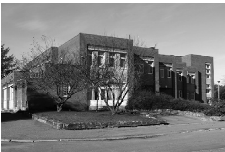
Šogad tiks sakārtota Iecavas veselības centra teritorija.