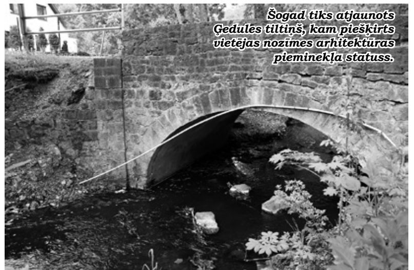
Šogad tiks atjaunots Ģedules tiltiņš, kam piešķirts vietējas nozīmes arhitektūras pieminekļa statuss.

Kopumā šiem būvdarbiem bija atvēlēti 301 384 eiro, no kuriem 44 493 eiro - izdevumi, kas segti no pašvaldības pamatbudžeta ieņēmumiem, bet 256 891 eiro - finansējums no Eiropas Lauksaimniecības fonda lauku attīstībai. Par iepirkuma procedūras uzvarētāju atzīta AS «A.C.B.», kuras piedāvātā līgumcena ir 225 152,69 eiro (bez PVN).