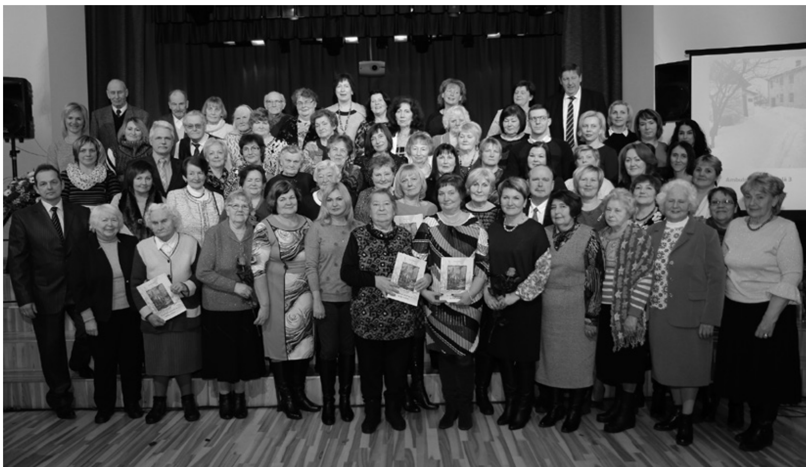
Iecavas veselības centra esošie un bijušie darbinieki Latvijas simtgades gadā. Šis foto varētu būt sākums nākamajai grāmatai par iestādes vēsturi, sprieda pasākuma dalībnieki.