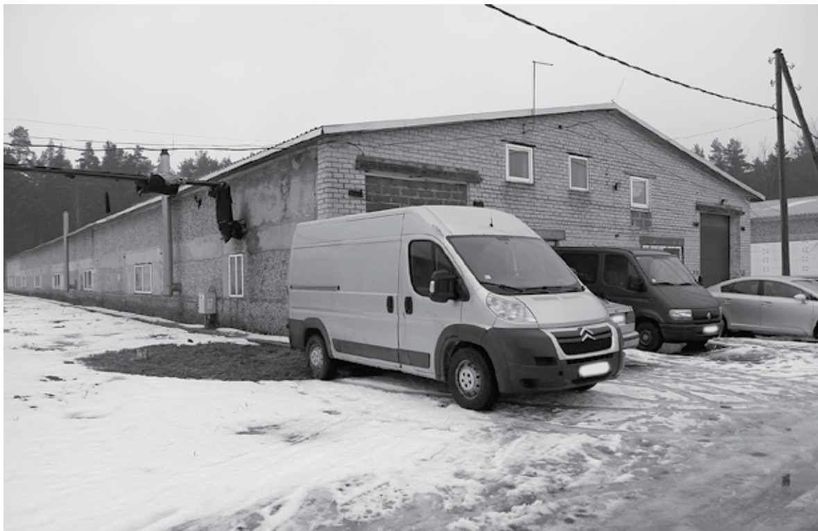
Kādreizējās fermas veiksmīgi pielāgotas nelielu uzņēmumu ražotnēm.

SIA «Wonderwood» kokapstrādes darbnīcā ražo koka rāmišus kanvām. Ražotne izveidota 2013. ga-