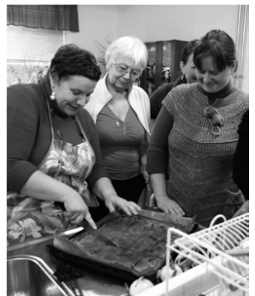
Karamelizētā ābolkūka izdevās aromātiska un garda.

Pasākums notika Eiropas Sociālā fonda (ESF) projekta Nr.9.2.4.2/16/I/038 «Vietējās sabiedrības veselības veicināšana un slimību profilakse Iecavas novadā» ietvaros. Projekta mērķis – vispārējās garīgās un fiziskās veselības uzlabošana Iecavas novada iedzīvotājiem. Lai sasniegtu mērķi, trīs gadu periodā no 2017.-2019. gadam pašvaldībā tiks organizētas 558 dažādas aktivitātes, kurās kā projekta mērķgrupa tiks iesaistīti 1854 Iecavas novada iedzīvotāji. Projekta kopējās izmaksas - 11607 eiro, no tām 85% ir ESF finansējums un 15% - valsts budžeta finansējums. [Z]