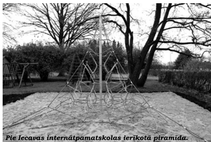
Pie Iecavas internātpamatskolas ierīkotā piramīda.