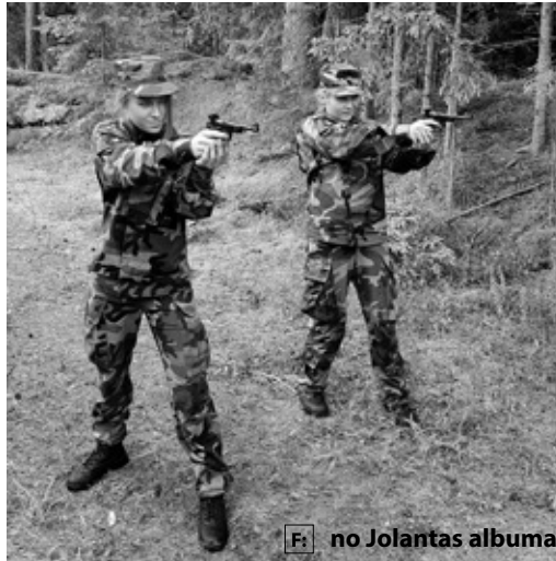
Fi no Jolantas albuma