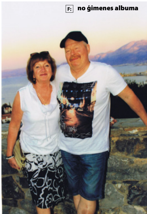
[F] no ģimenes albuma

- Katru rītu sagaidīt ar prieku, katru vakaru - ar gandarījumu. Būt drošam par rītdienu, veselam un laimīgam katru dienu. To es varētu novēlēt ne tikai sev, bet visiem iecavniekiem. [Z]