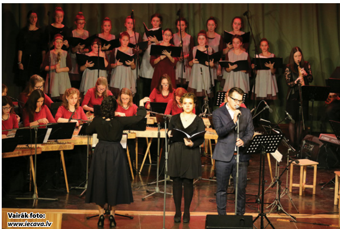
Vairāk foto: www.iecava.lv