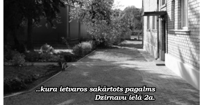
...kura ietvaros sakārtots pagalmis Dzīrnavu ielā 2a.

iekārtotais futbola laukums jau spējis sagādāt daudz prieka ne tikai bērniem, bet arī viņu vecākiem. Gadījies, ka futbola mači vasarā ieilguši līdz pat tumsai. Projekta īstenotāji atzina, ka darbus vēlas turpināt un sakārtot plašo iekšpagalma teritoriju.