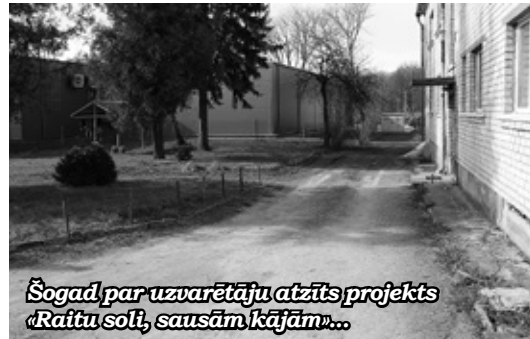
Šogad par uzvarētāju atzīts projekts «Raitu soli, sausām kājām»...