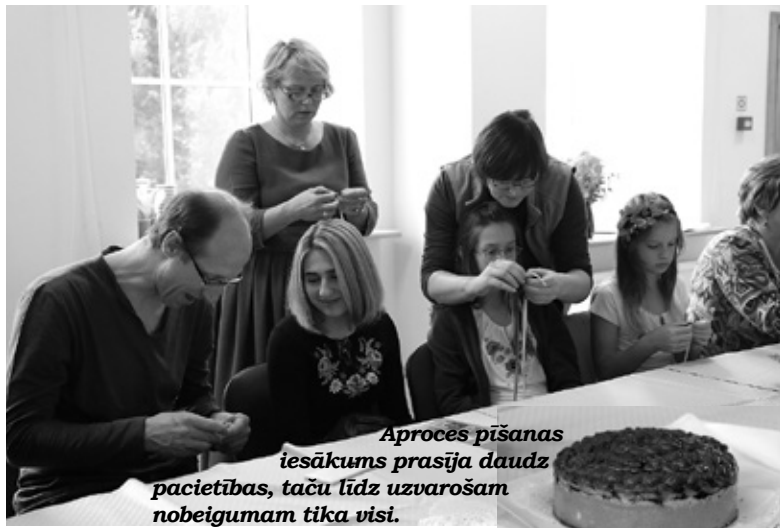
Aproces pišanas iesākums prasīja daudz pacietības, taču līdz uzvarošanai nobeigumam tika visi.

Pēc senajām tradīcijām arī kāzas parasti iesākās ar karavaja cepšanu. To varēja darīt tikai sie-