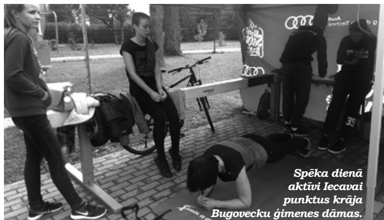
Spēka dienā aktīvi Iecavai punktus krāja Bugovecku ģimenes dāmas.