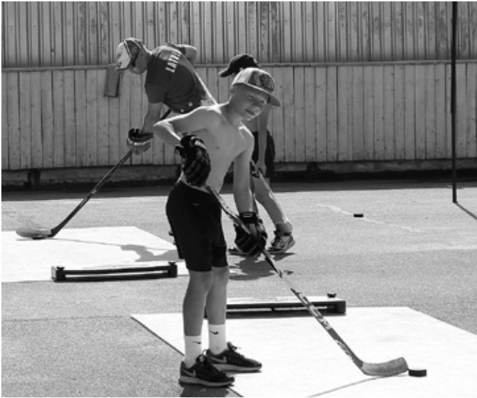
Nūjas tehnikas prasmes tiek slīpētas hokeja laukumā...