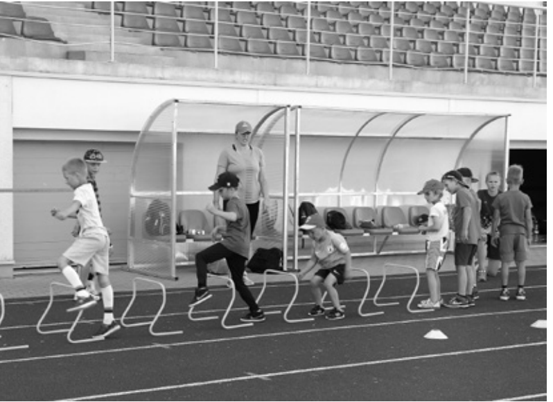
...savukārt fiziskās sagatavotības treniņi notiek Iecavas stadionā.

Nometnes ietvaros mazajiem hokejistiem ir iespēja apgūt nūjas tehnikas prasmes pie trenera un komandas HK Iecava dalībnieka,