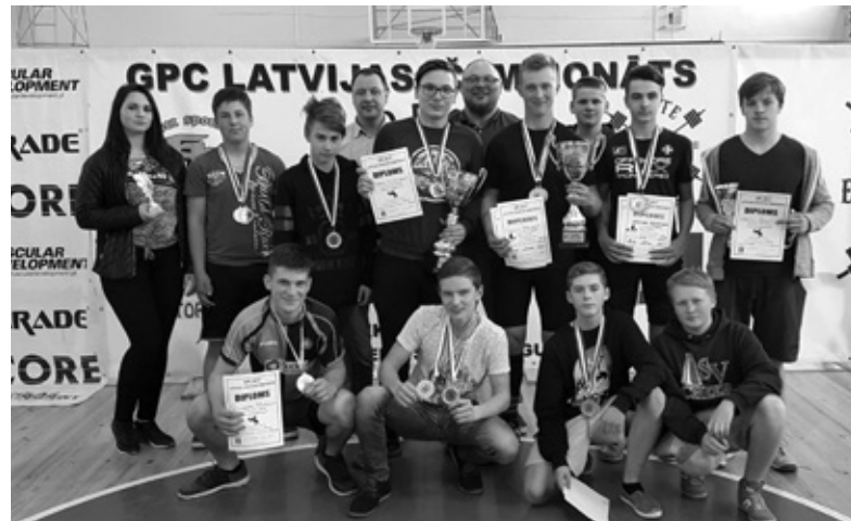
A: F: «FORTE IECAVA»