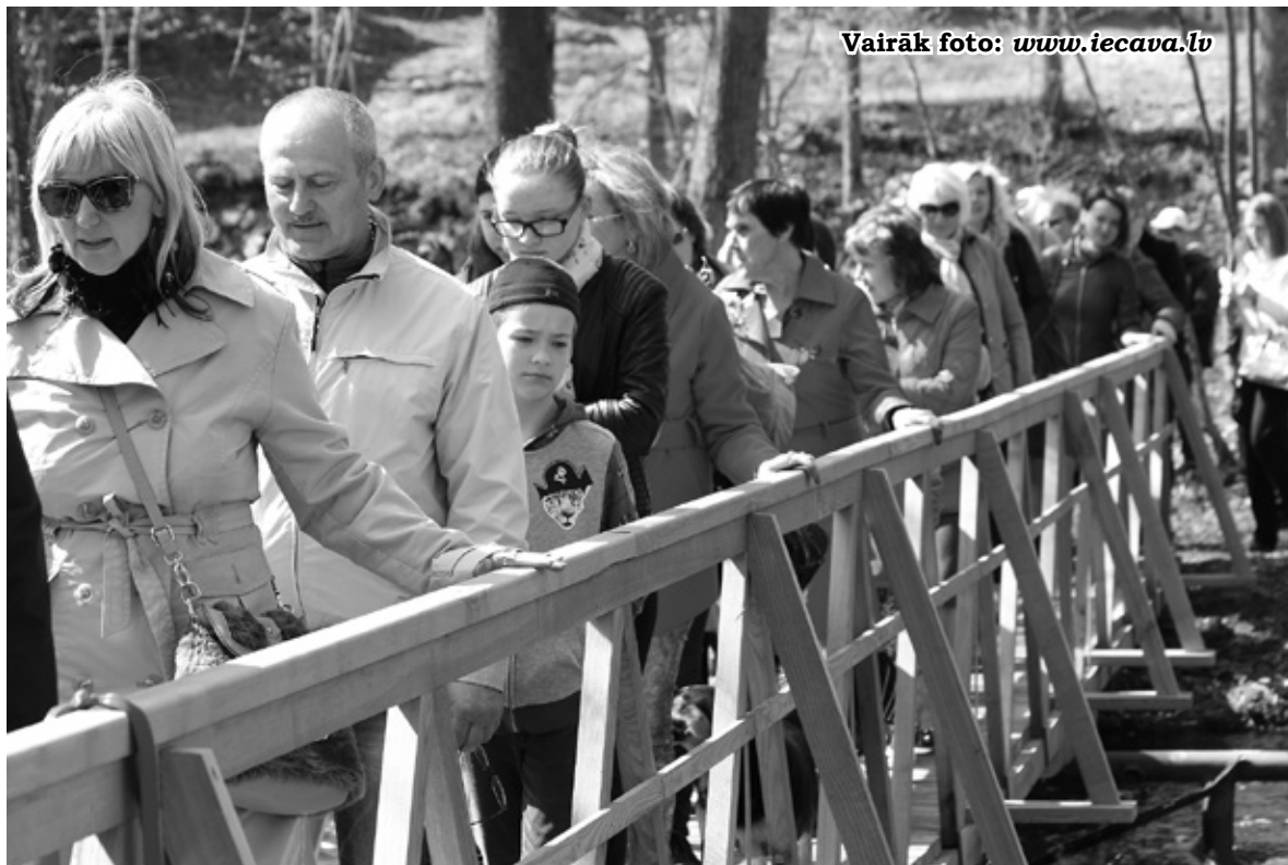
Vairāk foto: www.iecava.lv

Lai godinātu tos, kas visos laikos iestājušies par brīvu Latviju, pasākuma dalībnieki nolika ziedus pie Brīvības pieminekļa . Iespējams, turpmāk pulcēšanās pie brīvības