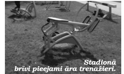
Stadionā brīvi pieejami āra trenažieri.

Elektroniskais tablo noder, lai uzskatāmāk noritētu komandu spēles. Iegādāti arī divi pārvietojamie strītbola grozi, kurus varēs izmantot turnīru rīkošanai stadionā, kā arī dažādot disciplīnas pašvaldības pasākumos aktīvās atpūtas zonā «Spirtnieki» un citviet novada teritorijā. Izmantojot jaunās basketbola, volejbola un svaru bumbas, iespējams pievērsties vispārējās fiziskās attīstības vingrojumam. Lai nodrošinātu prasībām atbilstošu futbola spēļu organizāciju, papildus ir iegādātas rezerves spēlētāju un tiesnešu nojumes.