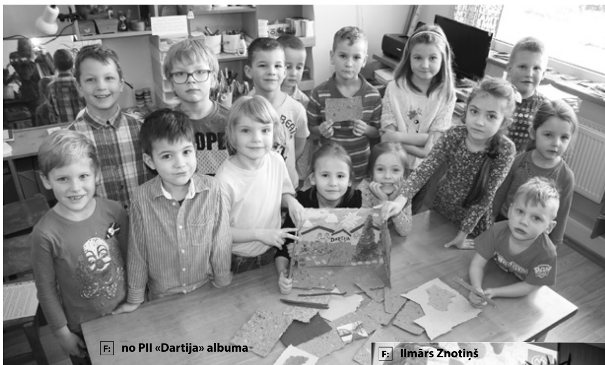
F: no PII «Dartija» albuma