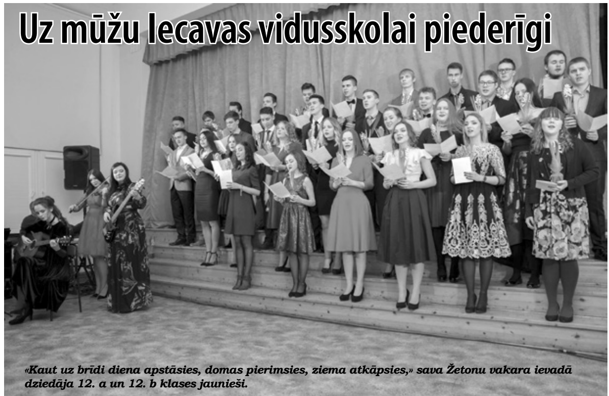
«Kaut uz brīdi diena apstāsies, domas pierimsies, ziema atkāpsies,» sava Žetonu vakara ievadā dziedāja 12. a un 12. b klases jaunieši.

Pasākuma otro daļu jau tradicionāli aizpildīja teātra izrāde. Šoreiz uzvedums tapis kā skolotāju un skolēnu kopdarbs, kuram dots nosaukums «Mantojums». Izrāde skolēnos atraišoja aktieru talantu, bet izspēlētās situācijas neatstāja