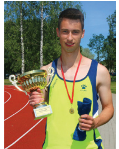
Pērn ātrākais sprinteris Iecavas vasaras sporta svētkos.

2016. gadā 2. vieta Latvijas čempionātā junioriem 60 metru skriešanā; 2. vieta valsts junioru reitingā gan 60 metru, gan 100 metru distancē (pēc sezonas labākā rezultāta); Latvijas olimpiādē 5. vieta 100 metru skriešanā pieaugušo grupā; 2017. gada februārī 4. vieta 60 m distancē Latvijas čempionātā telpās.