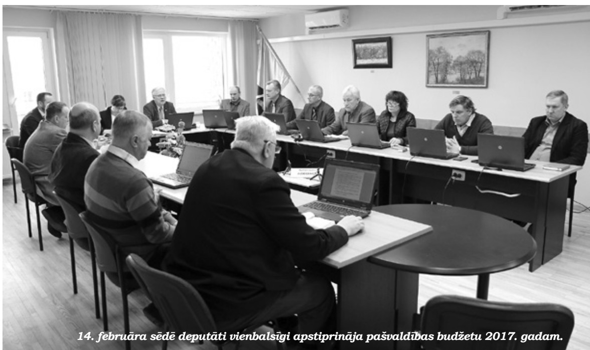
14. februāra sēdē deputāti vienbalsīgi apstiprināja pašvaldības budžetu 2017. gadam.

A: F: Lelde Podniece-Jostmane sabiedrisko attiecību speciāliste