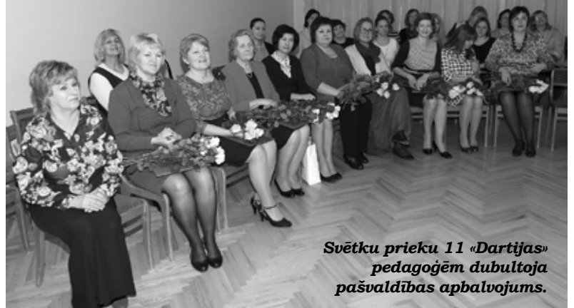
Svētku prieku 11 «Dartijas» pedagogēm dubultoja pašvaldības apbalvojums.