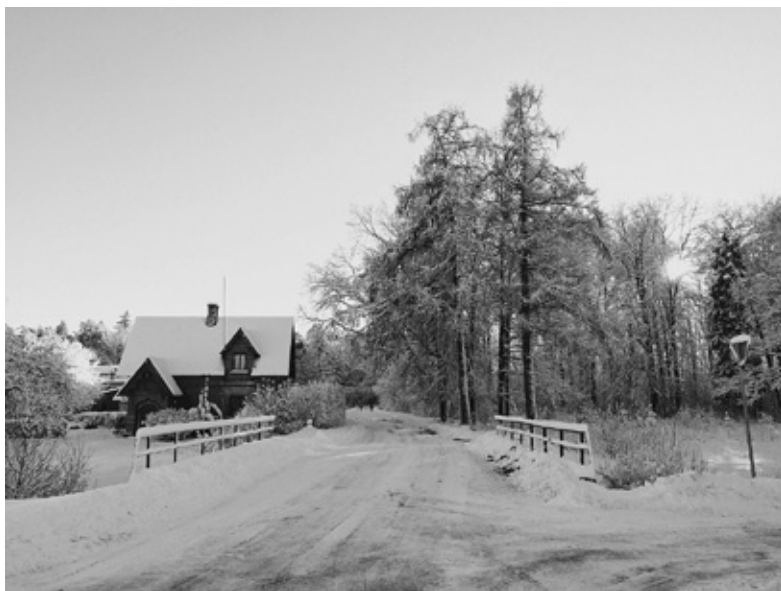
Novembra fotokonkursā «Iecavas novada mēneša foto» pārliecinoši uzvarējusi Aiva Avota-Zalstere.

Aivas Avotas-Zalsteres uzņemtā fotogrāfija Iecavas novada profilā www.facebook.com/iecavasnovads saņēma 106 atzīmes «Patīk» (Like).