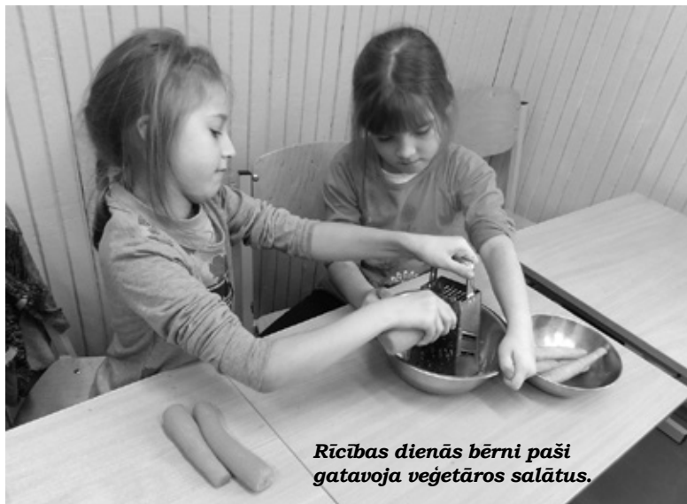
Rīcības dienās bērni paši gatavoja veģetāros salātus.