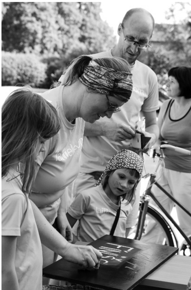
Komandas «Wi-Fi» lielākais izaicinājums sacensībās bija izturēt līdz finišam. Vairāk foto - www.iecava.lv

Pārējie komandas biedri uzsvēra, ka liela nozīme šādās sacensībās ir maršruta izpļānošanai.