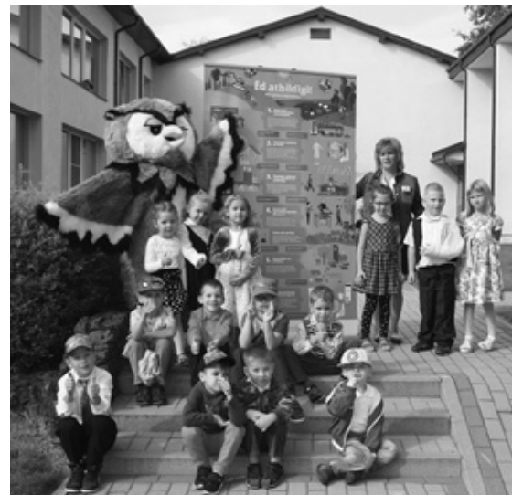
Uzsākot jauno mācību gadu, bērnodrāz «Dartija» iesaistījies starptautiskā projektā «Ēdam atbildīgi!», par ko liecina arī informatīvs plakāts pie iestādes.