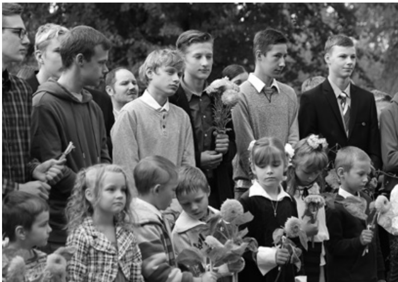
Vairāk foto no Zinību dienas skolās: www.iecava.lv