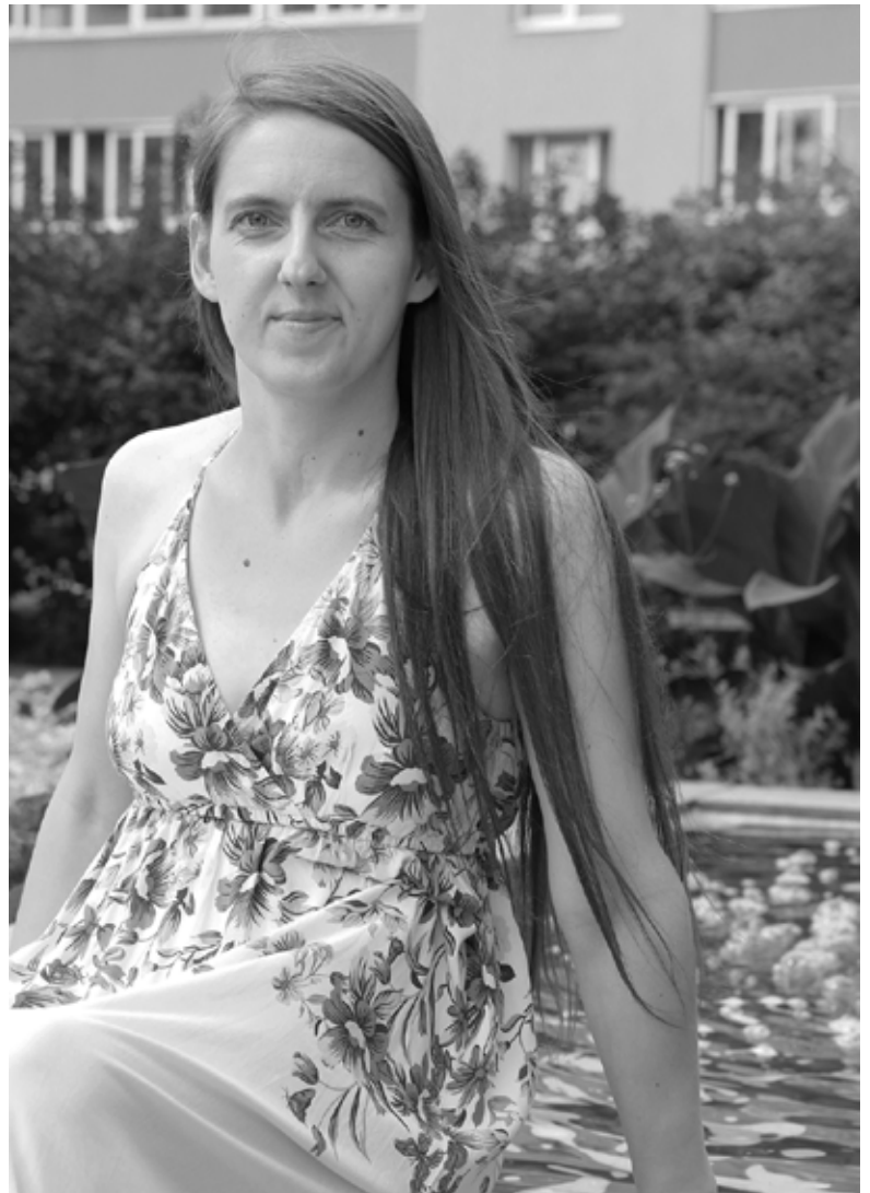
Janai mājās ir ļoti daudz pašas darinātu gleznu, tamborētu sedziņu un adītu zeķu. «Tur man ir pašai sava izstāde,» smeļ rokdarbniece.

Apkārtējo cilvēku attieksme vispār ir ļoti svarīga, jo, ja tā ir negatīva, ir grūti kaut ko turpināt darīt. Tāpēc es vēlos izteikt lielu pateicību par atbalsta sniegšanu mana talanta izkopšanā savai ģimenei, Sociālā dienesta meitenēm un dienas centram. Bez viņiem tas viss nešķistu tik interesanti. Es mudinu arī citus turpināt darīt to, kas patīk, un neapstāties pie viena sasniegta mērķa!»