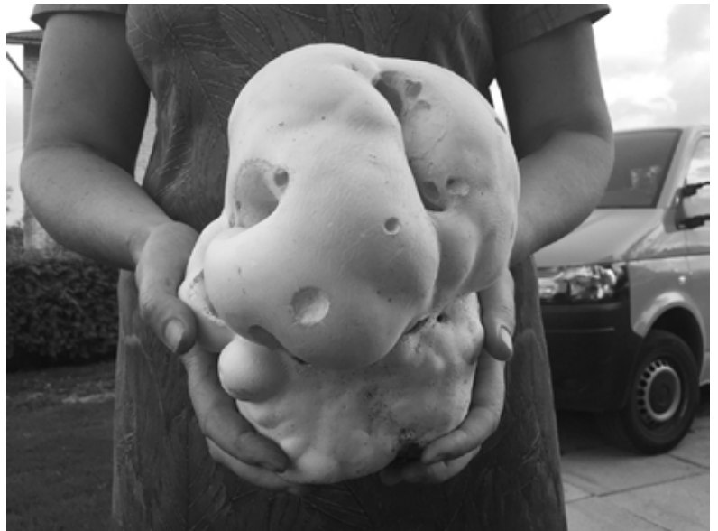
Parasti milzu apaļpūpēži ir apaļi, bet Inārai ticis tāds ar dziļiem iedobumiem. Pūpēža ārējais apvalks lobījies nost līdzīgi kā desas ādiņa.

Pēc garšas pūpēža karbonādes bija līdzīgas saulsardzenēm. Tās mums visiem ļoti garšo. Griežot šķēlēs, pūpēdis bija mazliet pārslains kā lauku biezpiens. Izcepts pēc struktūras ne sauss, ne