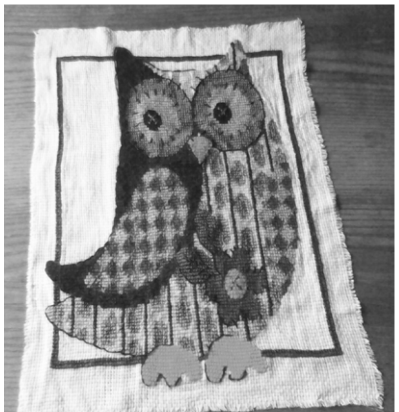
Izšūvumu autore atzīst, ka darba process nav tik aizraujošs, kā vēlme pēc iespējas ātrāk ieraudzīt gala rezultātu.