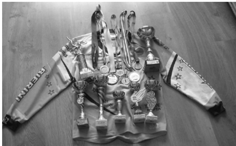
Par sasniegumiem 2015. gadā atgādina daudzās balvas. Šogad tām piepulcējušās vēl vairākas.