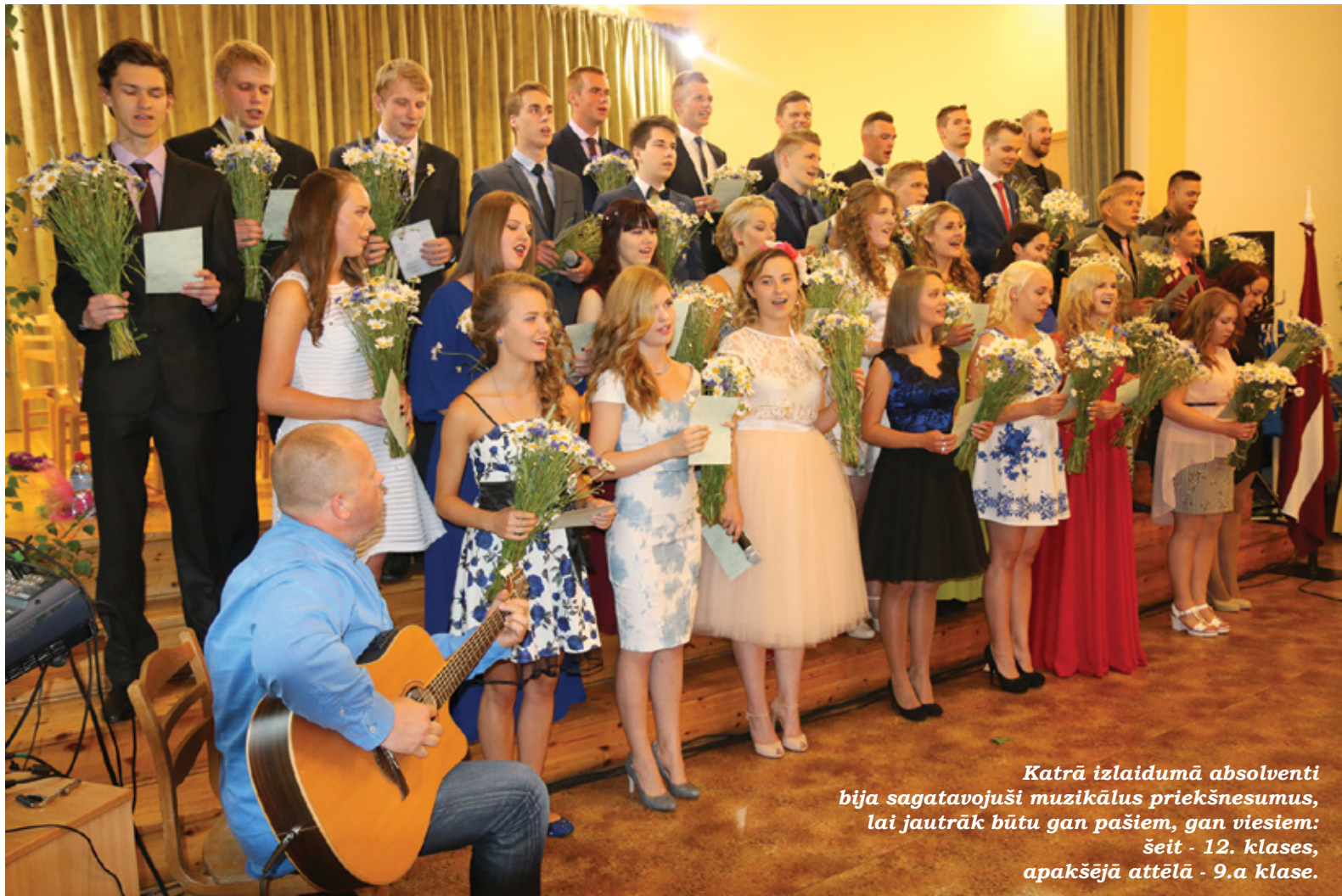
Katrā izlaidumā absolventi bija sagatavojuši muzikālus priekšnesumus, lai jautrāk būtu gan pašiem, gan viesiem: šeit - 12. klases, apakšējā attēlā - 9.a klase.