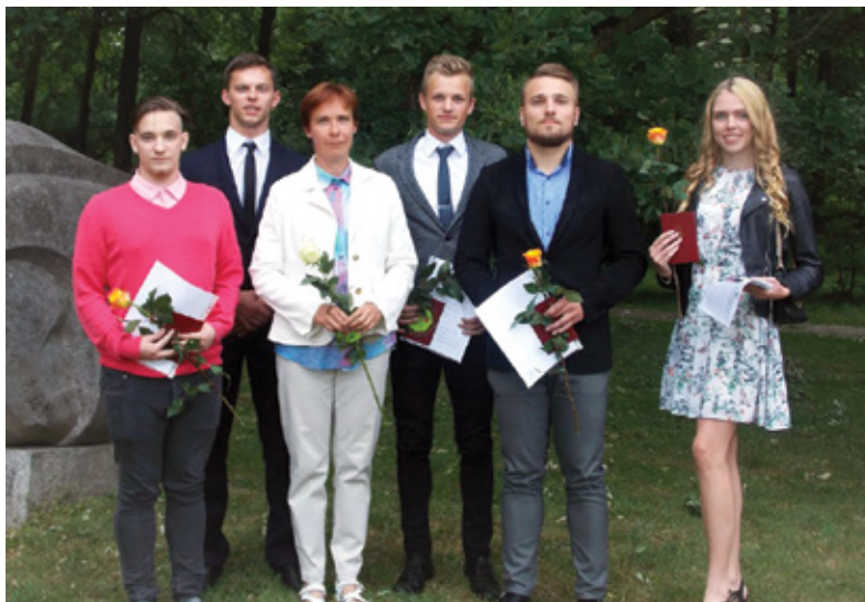
A: F: Lienīte Ludriķe sporta skolas lietvede

8. jūnijā apliecību par profesionālās izglītības iegūšanu saņēma deviņi Iecavas novada sporta skolas «Dartija» audzēkņi.