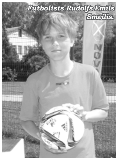
Vairāk foto: www.iecava.lv