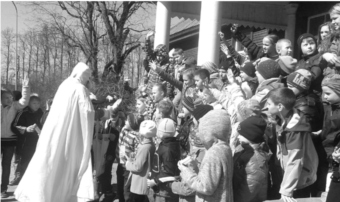
Skolas bērniem tikšanās ar atraktīvo Cūkmenu un viņa sportiskajām aktivitātēm deva jaunas zināšanas un prasmes.

Meža meistarstunda - rudens pusē Dzimtmīsis skolēni devās uz Kalsnavas arborētumu, kurā iepazīs neapmieramu koku krā-