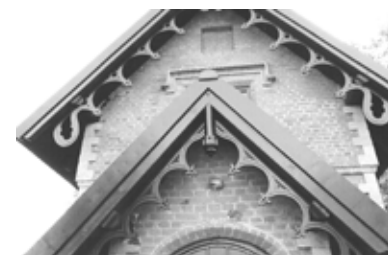
Rīgas ielas sargu namiņš.