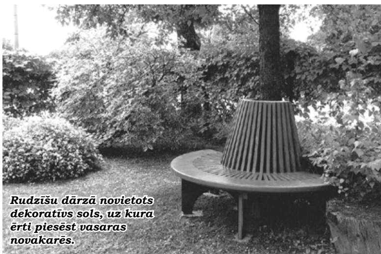
Rudzīšu dārzā novietots dekoratīvs solis, uz kura ērti piesēst vasaras novakarēs.