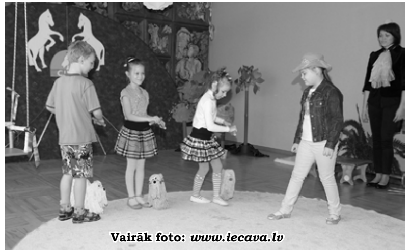
Vairāk foto: www.iecava.lv

Izrādes tapšanā palīdzējušas zināšanas, ko audzinātāja apgūvusi vairākosursos. Veidojot priekšnesumus, no katras pieredzes viņa kaut ko aizgūvusi, tad apcubinājusi un apdarinājusi ar pašas idejām. «Galvenais nosacījums, ja kaut ko iestudējam vai rādām, ir jābūt iesaistītiem visiem grupiņas bērniem, un tā tas bija arī šoreiz. Priekšnesumus parāli obligātajai mācību programmai apgūvām aptuveni trīs nedēļas. Bērni joprojām ir sajūsmā un viņiem neapnik.» [Z]