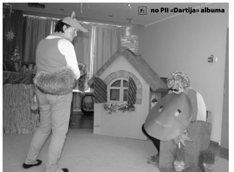
F: no PII «Dartija» albuma