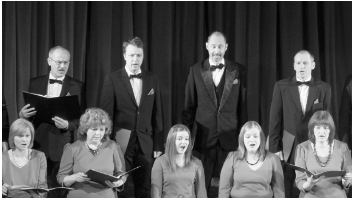
Jauktais koris «Iecava» svētdien notikušajā skatē saņēma augstāko vērtējumu.

Skatē piedalījās mazie un lielle «Tarkšķi», un abas grupas ieguva augstāko novērtējumu. Skatei bija nepieciešams sagatavot septiņu minūšu programmu par zirgu tēmu, kas ir arī «Pulkā eimu,