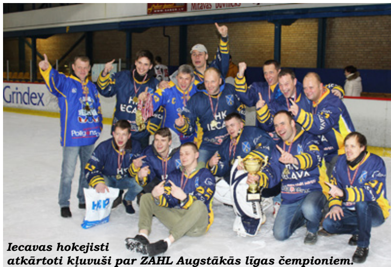
Iecavas hokejisti atkārtoti kļuvuši par Z AHL Augstākās līgas čempioniem.