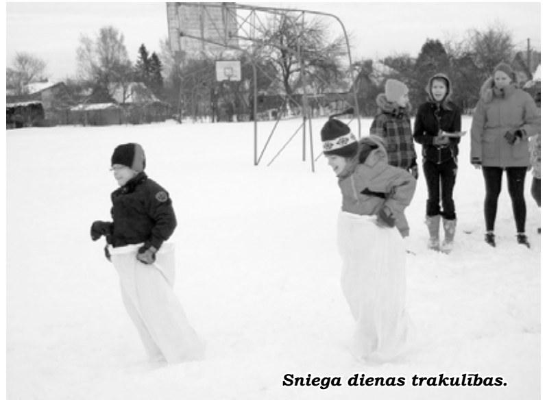
Sniega dienas trakulības.